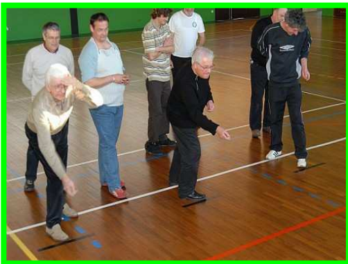
Position du pied

Le palet laiton se joue à 2m80 de la plaque