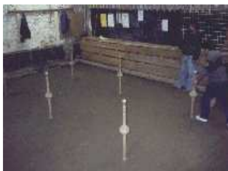
Joueur se préparant à jouer à la rue droite

On peut faire tomber au maximum 6 quilles en un seul coup.