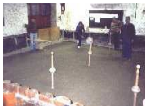
Joueur en train de « rebattre »